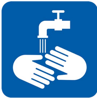
به‌رده‌وام ده‌سته‌کانت بشۆ