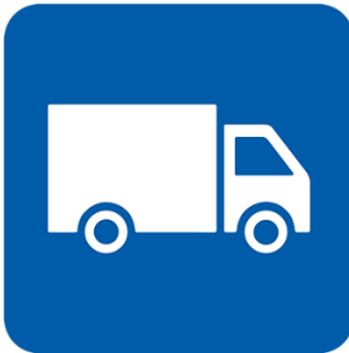
با خۆراک و دهرمانت بۆ ره‌وانه‌ بکهریت