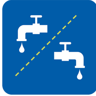
شتومه‌کی جیاواز به‌کار بینه، یان له نیوان به‌کار هیناندا پاکه‌ی بکه‌وه