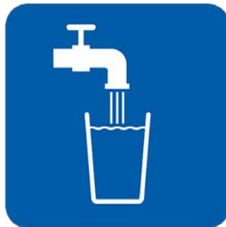
به‌ریکی زۆری ناو بخۆوه