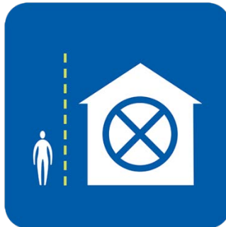
با سه‌ردانیکه‌رت نه‌بیت