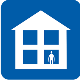
مه‌رۆ بۆ کار، قوتابخانه، نه‌شته‌رگه‌ری پزیشک، دهرمانخانه یان نه‌خۆشخانه