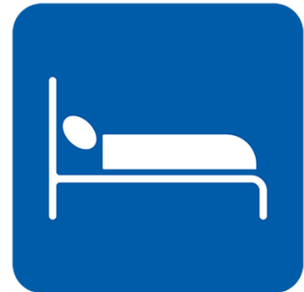
نه‌گه‌ر ده‌شیت به‌ ته‌نها بخه‌وه