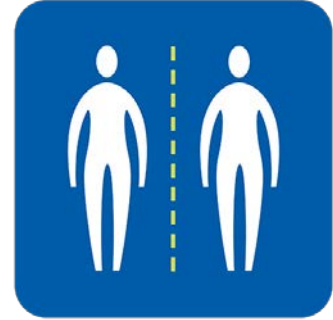
خۆت دوور بگره‌ له به‌رکه‌وتنی نزیک له‌گه‌ل که‌سانی تر